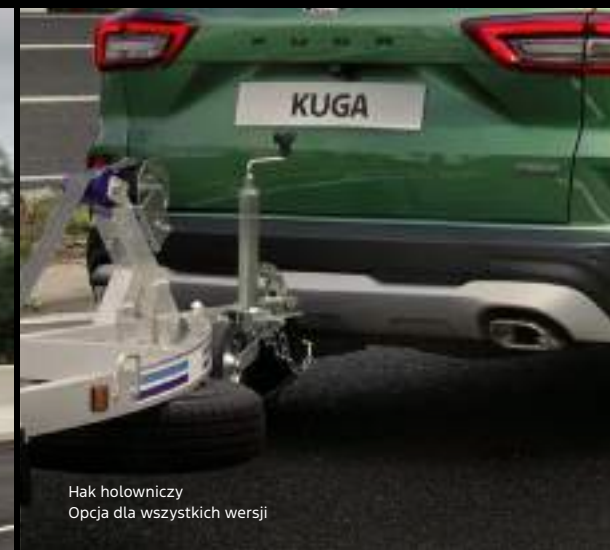
Hak holowniczy Opcja dla wszystkich wersji

Nowy Ford Kuga w wersji Active X z opcjonalnym wyposażeniem Kolor nadwozia: Bursting Green (bez dopłaty)