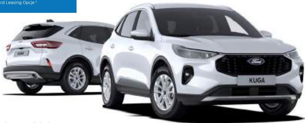
Nowy Ford Kuga w wersji Titanium Kolor nadwozia Frozen White (opcja)

netto mies. dla firm z Ford Leasing Opcje 1