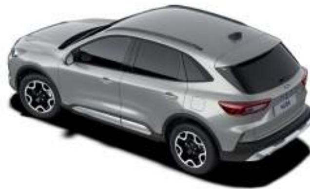
SOLAR SILVER - LAKIER METALIZOWANY 2 400 zł