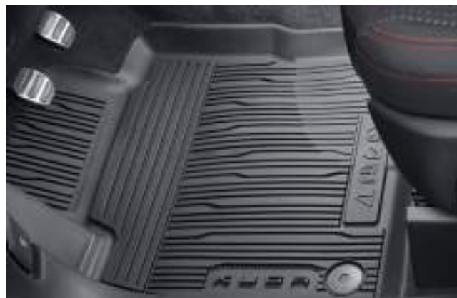
DYWANIKI PODŁOGOWE, GUMOWE - PRZEDNIE (LEWA I PRAWA STRONA) 279 zł