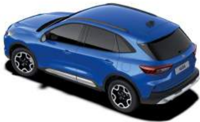
DESERT ISLAND BLUE - LAKIER METALIZOWANY SPECJALNY 3 200 zł