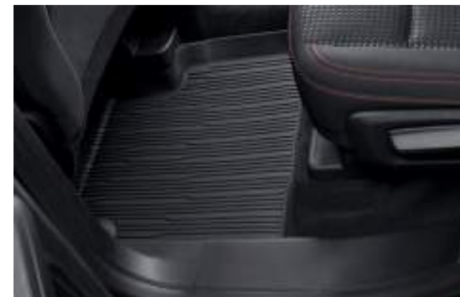
DYWANIKI PODŁOGOWE, GUMOWE - TYLNE (LEWA I PRAWA STRONA) 257 zł