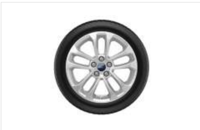
17" ALUMINIOWE KOŁA ZIMOWE ALUMINIOWE Z CZUJNIKAMI OPONA: DUNLOP WINTER SPORT 5 SUV, 225/65 R17 106H XL 6 004 zł