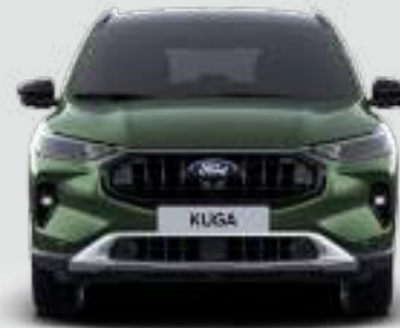
Szerokość całkowita z lusterkami bocznymi: 2177 mm