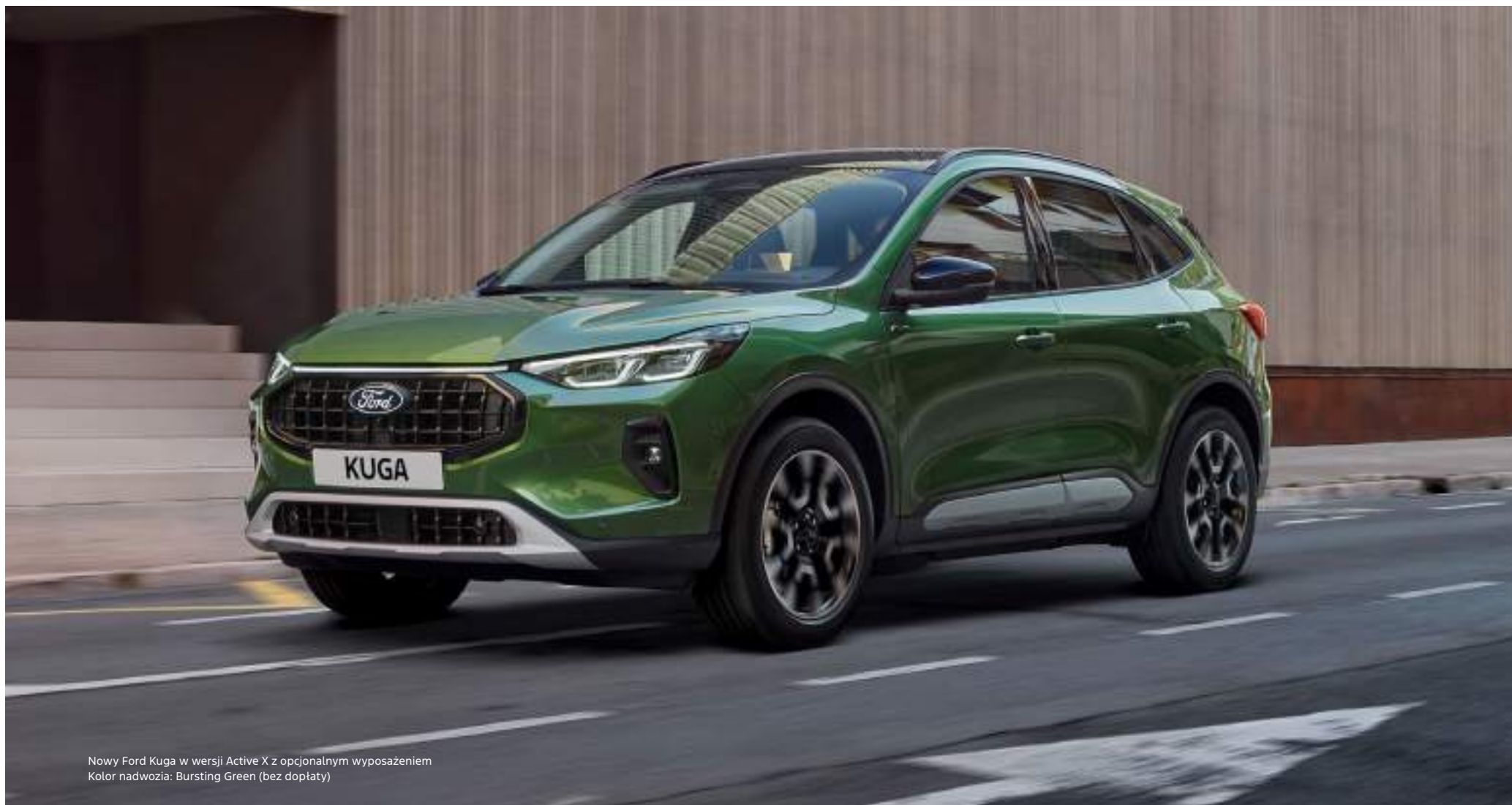
Nowy Ford Kuga w wersji Active X z opcjonalnym wyposażeniem Kolor nadwozia: Bursting Green (bez dopłaty)