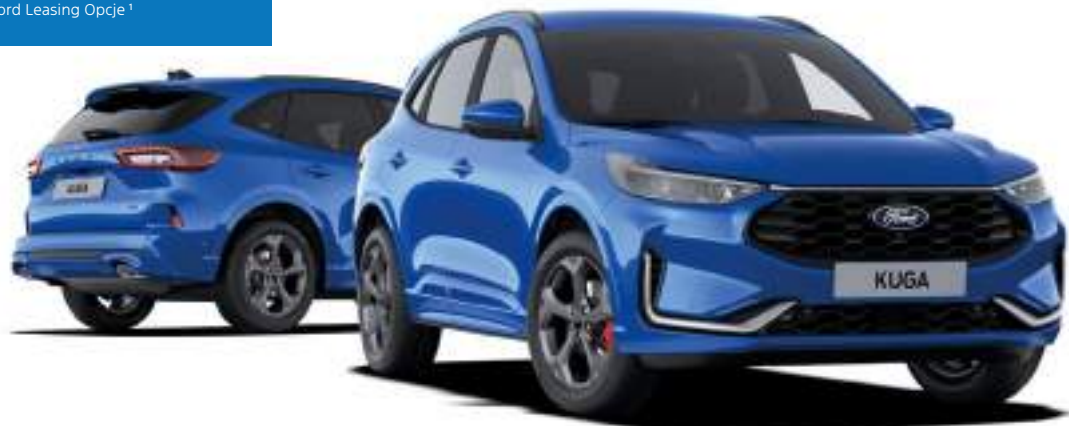
Nowy Ford Kuga w wersji ST-Line X Kolor nadwozia Desert Island Blue (opcja)

netto mies. dla firm z Ford Leasing Opcje 1