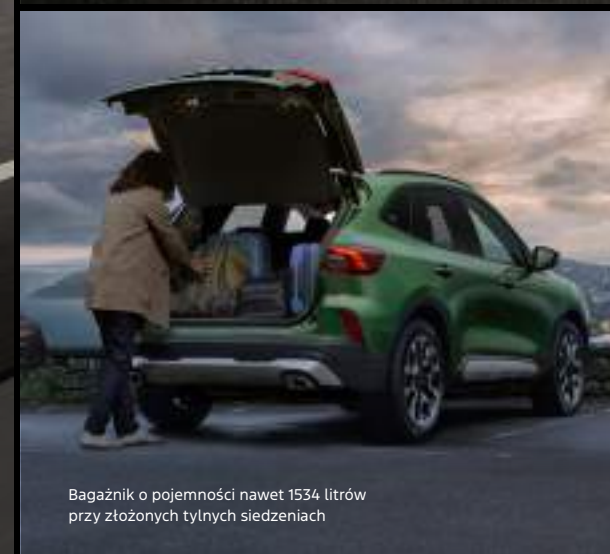
Bagażnik o pojemności nawet 1534 litrów przy złożonych tylnych siedzeniach