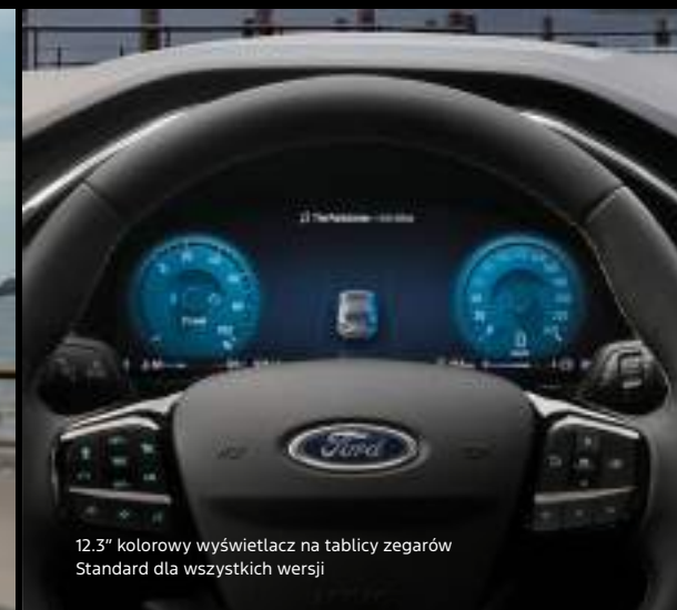
12.3" kolorowy wyświetlacz na tablicy zegarów Standard dla wszystkich wersji

Nowy Ford Kuga w wersji Active X z opcjonalnym wyposażeniem