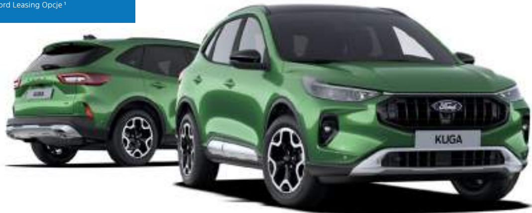
Nowy Ford Kuga w wersji Active X Kolor nadwozia Bursting Green (bez dopłaty)

netto mies. dla firm z Ford Leasing Opcje 1