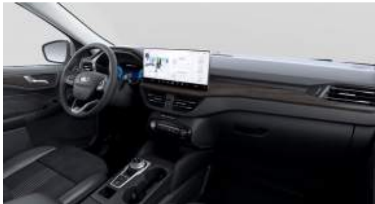
Nowy Ford Kuga w wersji Active X z tapicerką częściowo skórzaną w stylizacji active z przeszyciami w kolorze szarym (standard)