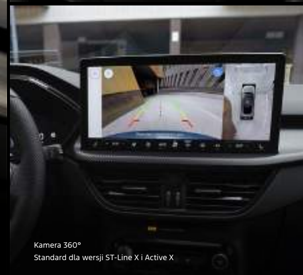
Kamera 360° Standard dla wersji ST-Line X i Active X