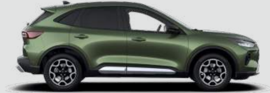
Długość całkowita Titanium: 4604 mm, ST-Line / ST-Line X: 4615 mm, Active / Active X: 4645 mm