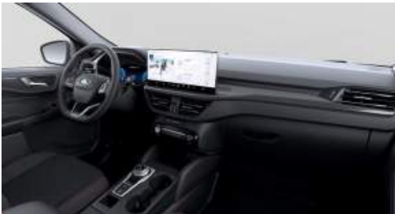
Nowy Ford Kuga w wersji ST-Line z tapicerką materiałową z czerwonymi akcentami (standard)