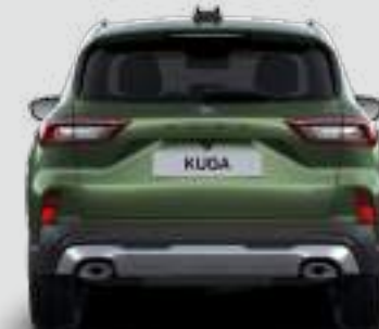
Szerokość całkowita ze złożonymi lusterkami: 2000 mm