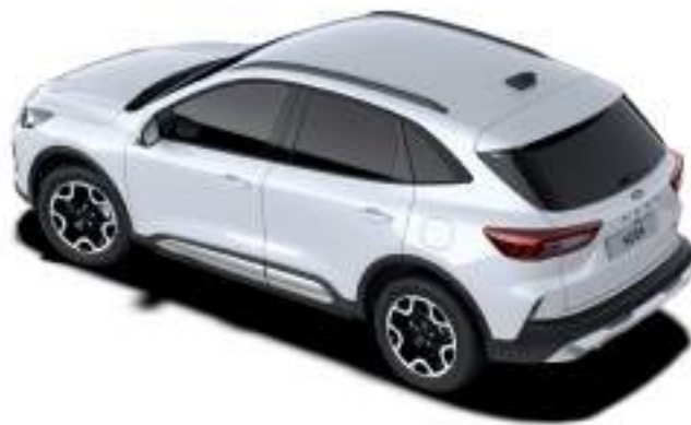
FROZEN WHITE - LAKIER ZWYKŁY 1 050 zł