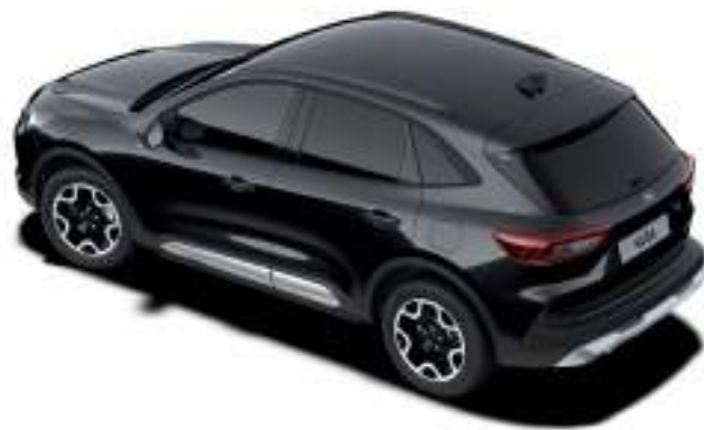
AGATE BLACK - LAKIER METALIZOWANY 2 400 zł