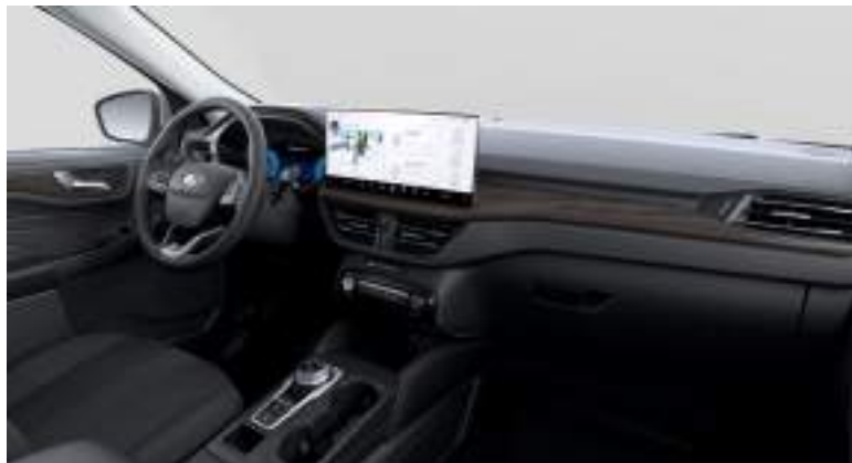
Nowy Ford Kuga w wersji Active z tapicerką materiałową w stylizacji Active, z przeszyciami w kolorze szarym (standard)