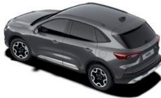
MAGNETIC GREY - LAKIER METALIZOWANY SPECJALNY 3 200 zł