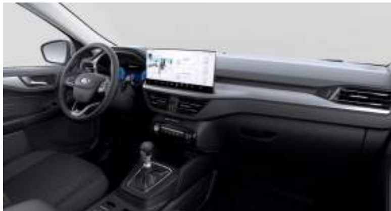
Nowy Ford Kuga w wersji Titanium z manualną skrzynią biegów i tapicerką materiałową (standard)