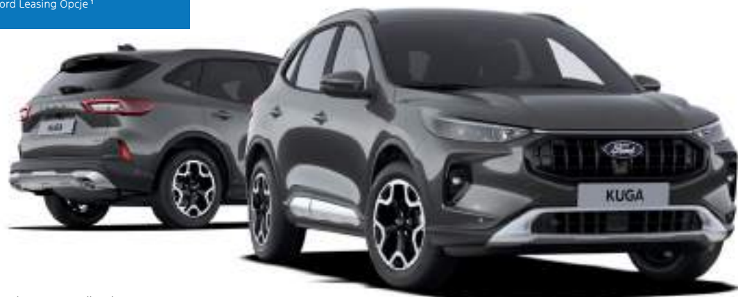
Nowy Ford Kuga w wersji Active Kolor nadwozia Magnetic Grey (opcja)

netto mies. dla firm z Ford Leasing Opcje 1