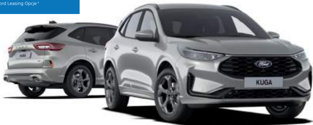
Nowy Ford Kuga w wersji ST-Line Kolor nadwozia Solar Silver (opcja)

netto mies. dla firm z Ford Leasing Opcje 1