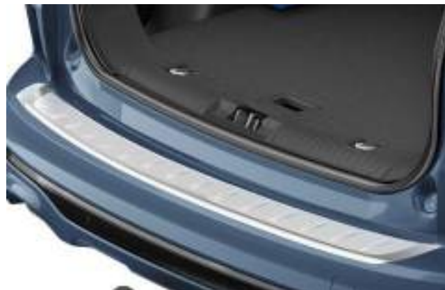
OCHRONA NAKŁADKA ZE STALI NIERDZEWNEJ NA TYLNY ZDERZAK 819 zł (dla wersji ST-Line i ST-Line X)