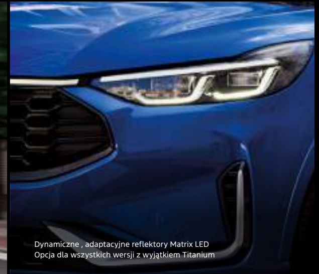
Dynamiczne, adaptacyjne reflektory Matrix LED Opcja dla wszystkich wersji z wyjątkiem Titanium

Nowy Ford Kuga w wersji ST-Line X z opcjonalnym wyposażeniem Kolor nadwozia: Desert Island Blue (opcja)