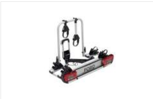
MOCOWANY NA HAKU - UCHWYT NA 2 ROWERY (ATERA - STRADA SPORT 2) 3 522 zł