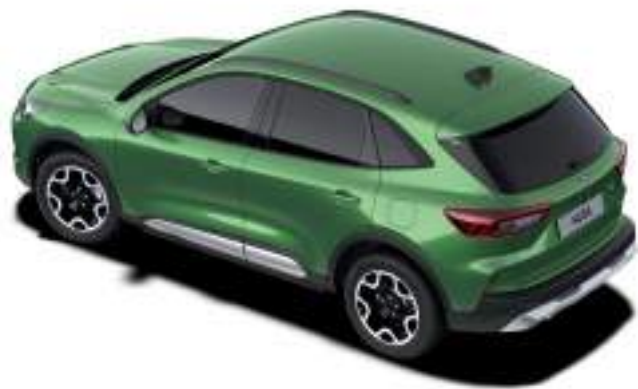
BURSTING GREEN - LAKIER METALIZOWANY bez dopłaty